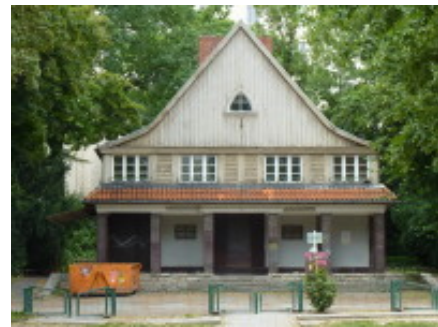
Parkwächterhäuschen im Lietzenseepark, 11.7.2013

Bezirksamt Charlottenburg-Wilmersdorf von Berlin Abteilung Stadtentwicklung und Ordnungsangelegenheiten Straßen- und Grünflächenamt Fehrbelliner Platz 4, 10707 Berlin Tel (030) 9029 14480 Fax (030) 9029 14410 E-Mail: cw740001@charlottenburg-wilmersdorf.de